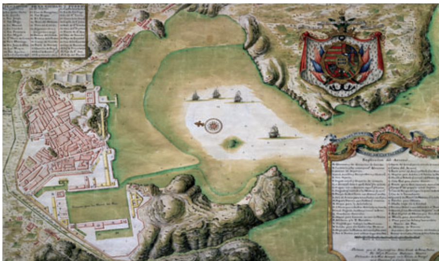
La fundación del arsenal en Cartagena en 1731 convirtió a la ciudad en uno de los puertos marítimos más importantes del Mediterráneo.

En la labor reformista de los borbones destaca el papel desempeñado por el murciano conde de Floridablanca , que fue secretario de Estado entre 1777 y 1792. Durante su primera etapa de gobierno reflejó el ideario del despotismo ilustrado de su época, si bien con Carlos IV su política se vio modificada debido a la Revolución francesa.